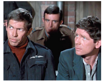
1962 LA GRANDE ÉVASION (The great Escape) de John Sturges avec Robert Desmond