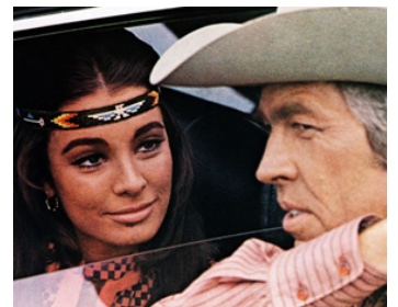
1971 LES CENTAURES (The Honkers) de Steve Inhat avec Anne Archer