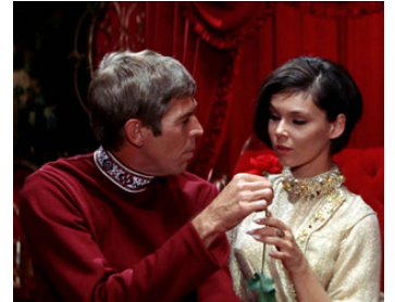
1966 F COMME FLINT (In Like Flint) de Gordon Douglas avec Yvonne Craig