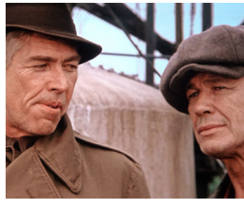
1974 LE BAGARREUR (Hard Times) de Walter Hill avec Charles Bronson