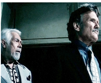
1998 PAYBACK (Payback) de Brian Helgeland avec Kris Kristofferson