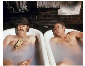
1975 LA CHEVAUCHÉE SAUVAGE (Bite the Bullet) de Blake Edwards avec Gene Hackman