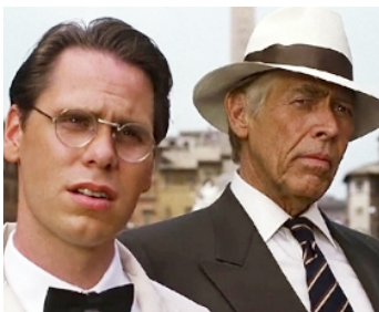
1990 HUDSON HAWK, GENTLEMAN CAMBRIOLEUR (Hudson Hawk) de M. Lehmann avec Don Harvey