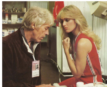
1979 DE L'OR AU BOUT DE LA PISTE (Goldengirl) de Joseph Sargent avec Susan Anton