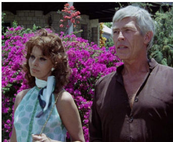
1978 L'ARME AU POING (Firepower) de Michael Winner avec Sophia Loren