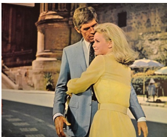
1968 CET HOMME EST PRÊT À TOUT (Hard Contract) de S. Lee Pogostin avec Lee Remick