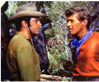
1958 LA CHEVAUCHÉE DE LA VENGEANCE (Ride lonesome) de B. Boetticher avec Pernell Roberts