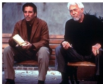
2000 THE MAN FROM ELYSIAN FIELDS de George Hickenlooper avec Andy Garcia