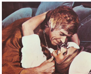
1972 LES INVITATIONS DANGEREUSES (The Last of Sheila) d'Herbert Ross avec Dyan Cannon