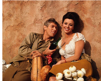
1965 QU'AS-TU FAIT À LA GUERRE PAPA ? (What did you do in the war) de B. Edwards avec Giovanna Ralli