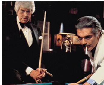
1979 REVANCHE À BALTIMORE (The Baltimore Bullet) de Robert Ellis Miller avec Omar Sharif