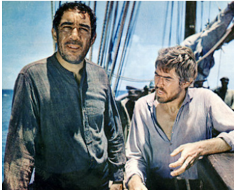
1965 CYCLONE À LA JAMAÏQUE (A high wind in Jamaica) d'A. Mackendrick avec Anthony Quinn