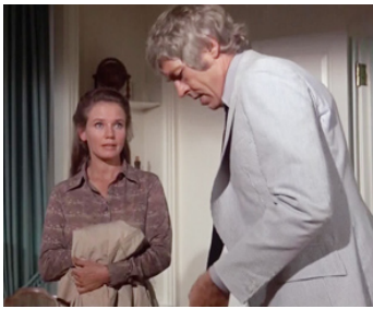
1973 HARRY, GENTLEMAN PICKPOCKET (Harry in you pocket) de B. Geller avec Trish Van Devere