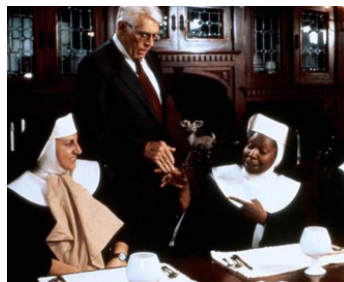
1993 SISTER ACT 2 (Sister Act 2, Back in the Habit) de Bill Duke avec Whoopi Goldberg