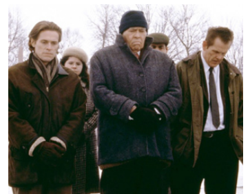
1997 AFFLICTION (Affliction) de Paul Schrader avec Willem Dafoe, Nick Nolte