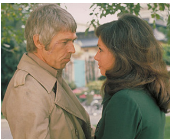
1971 OPÉRATION CLANDESTINE (The Carey Treatment) de B. Edwards avec Jennifer O'Neill