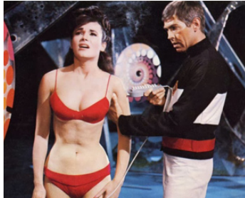
1965 NOTRE HOMME FLINT (Our Man Flint) de Daniel Mann avec Gila Golan