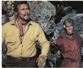
1975 LA LOI DE LA HAINE (The last hard Men) d'Andrew V. McLaglen avec Charlton Heston