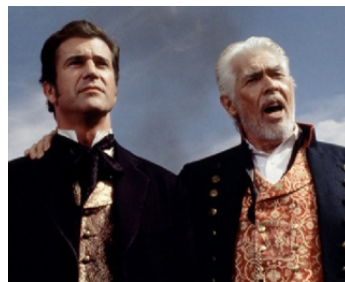
1993 MAVERICK (Maverick) de Richard Donner avec Mel Gibson