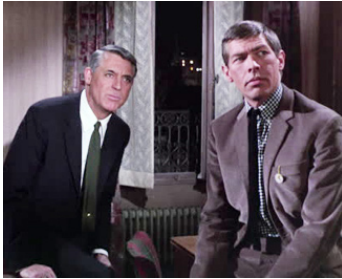
1963 CHARADE (Charade) de Stanley Donen avec Cary Grant