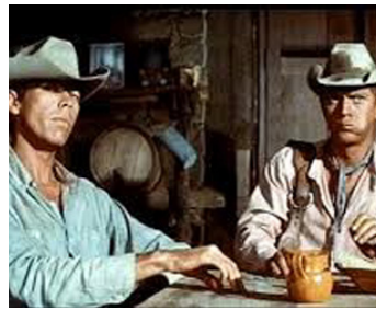
1960 LES SEPT MERCENAIRES (The Magnificent Seven) de John Sturges avec Steve McQueen