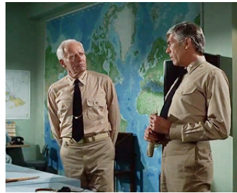
1976 LA BATAILLE DE MIDWAY (Midway) de Jack Smight avec Henry Fonda