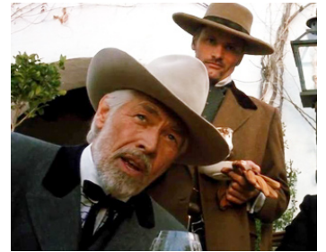
1989 YOUNG GUNS II (Blaze of Glory) de Geoff Murphy avec Viggo Mortensen