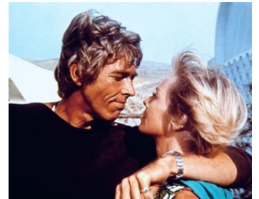
1967 DUFFY, LE RENARD DE TANGER (Duffy) de Robert Parrish avec Susannah York