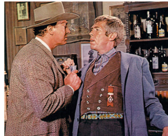
1967 L'OR DES PISTOLEROS (Waterhole #3) de William A. Graham avec Claude Akins