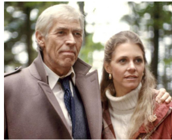
1985 MARTIN'S DAY (Martin's Day) d'Alan Gibson avec Lindsay Wagner