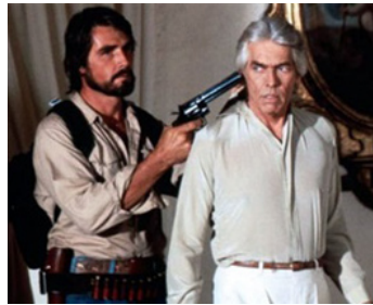
1981 LES RISQUES DE L'AVENTURE (High Risk) de Stewart Raffill avec James Brolin