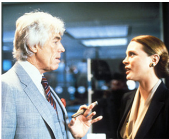
1981 LOOKER (Looker) de Michael Crichton avec Leigh Taylor-Young