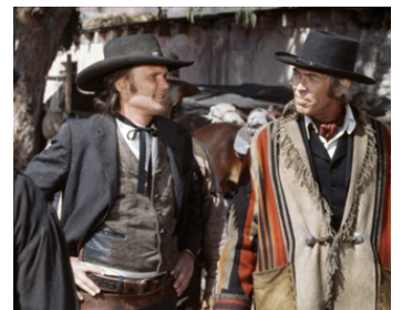
1973 PAT GARRET ET BILLY LE KID (Pat Garrett & Billy the Kid) de S. Peckinpah avec K. Kristofferson