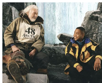
2001 CHIENS DE NEIGES (Snow Dogs) de Brian Levant avec Cuba Gooding Jr