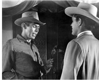
1963 THE MAN FROM GAVELSTONE de William Conrad avec Jeffrey Hunter