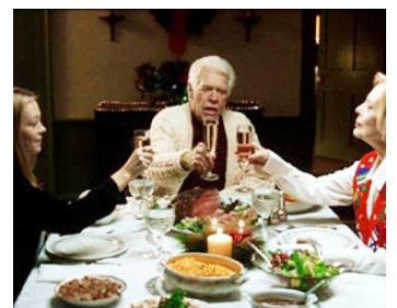
2002 AMERICAN GUN (American Gun) d'Alan Jacobs avec Virginia Madsen