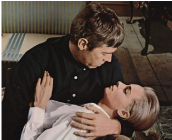
1966 UN TRUAND (Dead Heat on a merry-go-round) de Bernard Girard avec Camilla Sparv