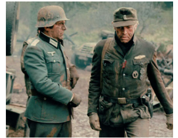
1976 CROIX DE FER (Cross of Iron) de Sam Peckinpah avec Maximilian Schell