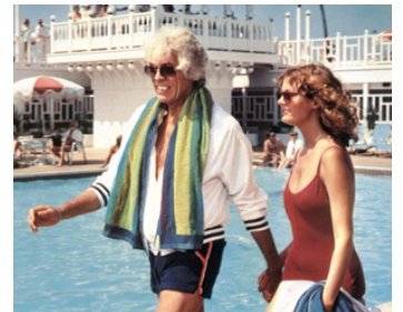
1980 L'AMOUR À QUATRE MAINS (Loving Couples) de Jack Smight avec Susan Sarandon