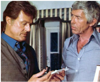
1975 INTERVENTION DELTA (Sky Riders) d'Anthony Hickox avec Robert Culp