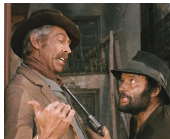
1970 IL ÉTAIT UNE FOIS LA RÉVOLUTION (Giù la testa) de Sergio Leone avec Rod Steiger