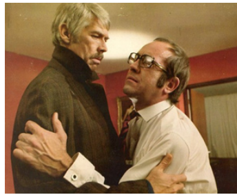
1974 CRIME À DISTANCE (The Internecine Project) de Ken Hughes avec Ian Hendry