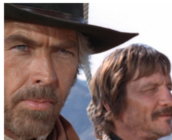
1972 LA HORDE DES SALOPARDS (Una ragione per vivere e una per morire) de Tonino Valerii