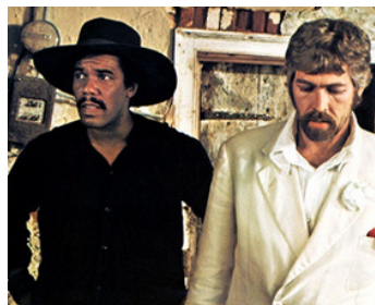
1969 THE LAST MOBILE HOT SHOTS de Sidney Lumet avec Robert Hooks