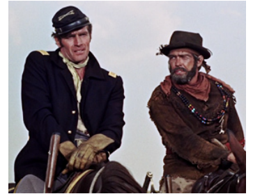
1965 MAJOR DUNDEE (Major Dundee) de Sam Peckinpah avec Charlton Heston